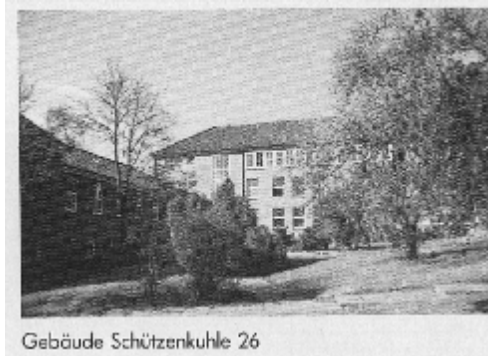
Gebäude Schützenkuhle 26

Außerdem führt das verstärkte Eindringen junger Mädchen in gewerbliche Berufe zu einem erneuten Ansteigen der Schülerzahlen.