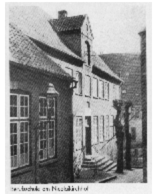
Realschule in Neustadt