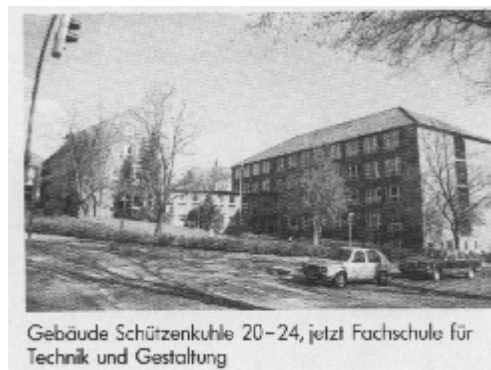
Gebäude Schützenkuhle 20-24, jetzt Fachschule für Technik und Gestaltung

Nach langer Planungsphase und zwei jähriger Bauzeit wird die Gewerbliche Berufsschule in der Schützenkuhle 20-24 eingeweiht.