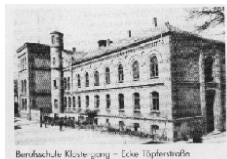
Berufsschule Kloostergang - Ecke Töpferstraße

1921 Die kaufmännische Berufsschule für männliche und weibliche Lehrlinge wird dem zum Direktor der städtischen Handelslehranstalten gewählten Diplomhandelslehrer Lehmann unterstellt. Im gleichen Jahr ziehen Teile der gewerblichen Fortbildungsschule in freiwerdende Räume des Alten Gymnasiums am Kloostergang.